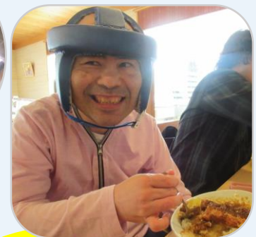
おいしいご飯もありました！