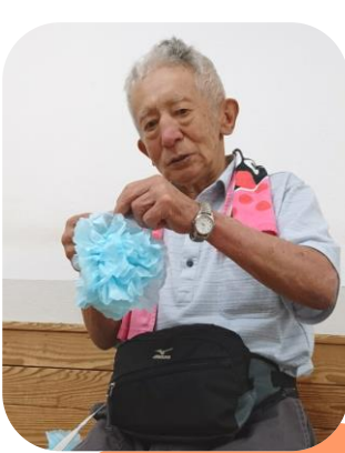
手先を器用に使って 作品を製作します★