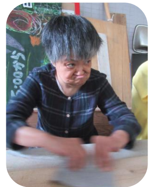
充実した活動が、展開されています。