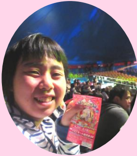
わくわく、ドキドキ♪