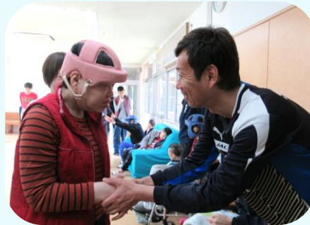
1人1人と お別れの言葉を...

お別れ会の最後には、利用者の皆さんで書いた手作りの色紙と、花束が渡されました。寂しいお別れの場でしたが、色紙を見ながら笑顔がこぼれるお別れ会となりました。(重信)