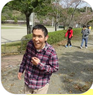
散策やレクリエーションを楽しみました♪