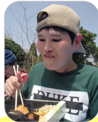
おいしいお弁当ににこにこ笑顔😊