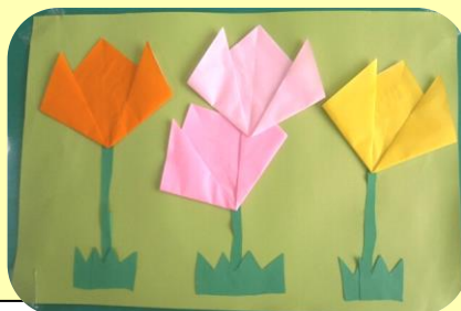
春らしい作品たちが 並びます(^ ^)