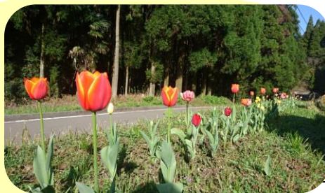
吉田愛青園の グラウンドや駐車場にも 春の訪れが...♪