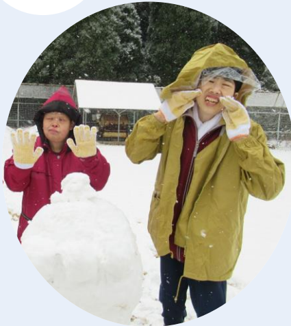
みなさん大はしゃぎ♪