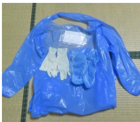
入室時の エプロンや マスクのセット