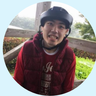
雨の中でも笑顔で歩くぞ！