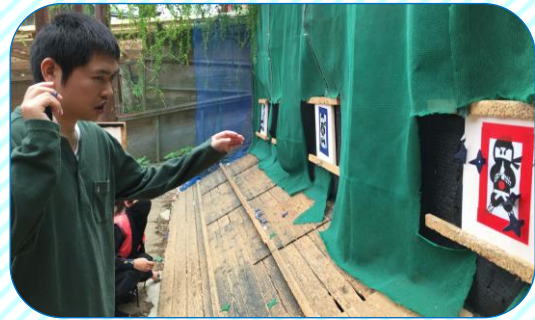
的に狙いをさだめて手裏剣を投げます。