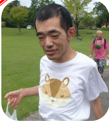
K・Kさん お菓子とジュース どこで食べようかな～。