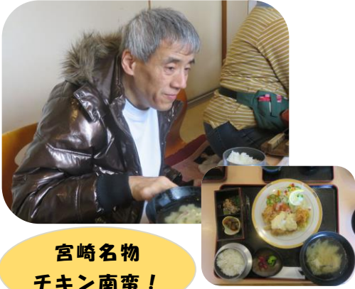
宮崎名物 千キン南蛮！

三月九〜一〇日、一泊旅行に行ってきました。初日の目は、志布志のイルカランドのイルカショーです。イルカの様々な芸に声を上げて喜ぶみなさん。イルカが投げたボールを水槽に投げ返すコーナーでは、飛んできたボールを優しくイルカに返す微笑ましいシーンも見られました。